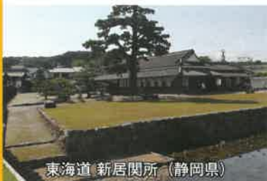
東海道 新居関所 (静岡県)