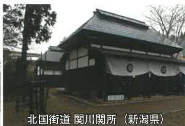
北国街道 関川関所 (新潟県)