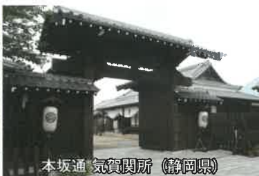
本坂道 気賀関所 (静岡県)