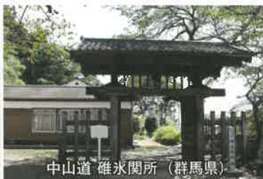
中山道 碓氷関所 (群馬県)